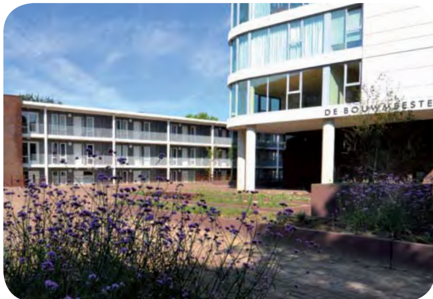
De nieuwe locatie van SWZ aan de Tonnaerstraat.

In juli heeft SWZ twee nieuwe woonvormen in Eindhoven in gebruik genomen aan de Tonnaerstraat en aan de Palladiostraat. De cliënten van de woonvormen Brasschaatpad in Eindhoven en J.J. de Vlamstraat in Best zijn verhuisd naar hun nieuwe appartementen.