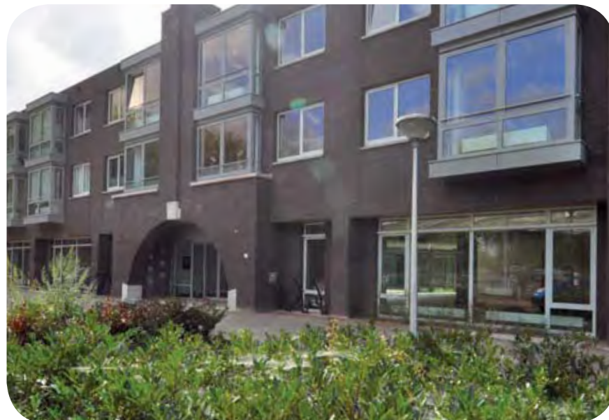
Het nieuwe wooncomplex én activiteitscentrum aan de Palladiostraat.

De meeste bewoners hebben eerder al aan de Tonnaerstraat gewoond. Om de nieuwbouw te kunnen realiseren zijn zij tijdelijk naar het Brasschaatpad en de J.J. de Vlamstraat verhuisd. Helaas heeft de tijdelijke verhuizing door omstandigheden bijna 7 jaar geduurd. De cliënten waren dus ook erg blij dat ze weer terug konden naar hun oude stekje, maar dan in een gloednieuwe woning.